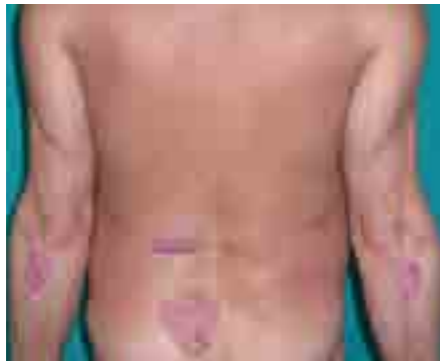
Luskavica v plakih

Razvije se lahko kjerkoli drugje, tudi na nohtih, dlaneh, stopalih, spolovilih, zelo redko pa na obrazu .